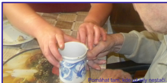
Pomáhat tam, kde už síly nestačí.