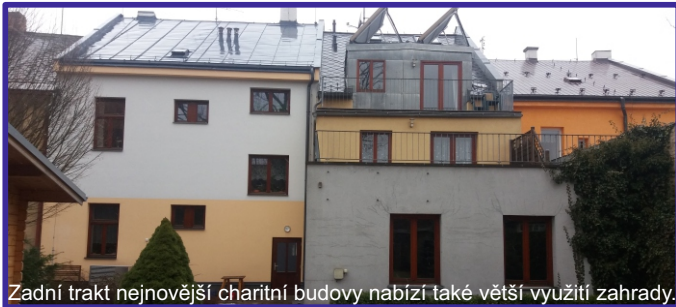
Zadní trakt nejnovější charitní budovy nabízí také větší využití zahrady.

Pro terénní sociální služby je vozový park nezbytností, tvrdí Š. Dvořáková.