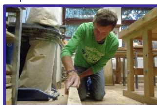
Práce jim dělá radost.

Práce je pro lidi s mentálním postižením důležitá, protože dává jejich životu náplň.