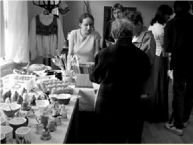
Velikonoční výstava „Pod skořápkou“