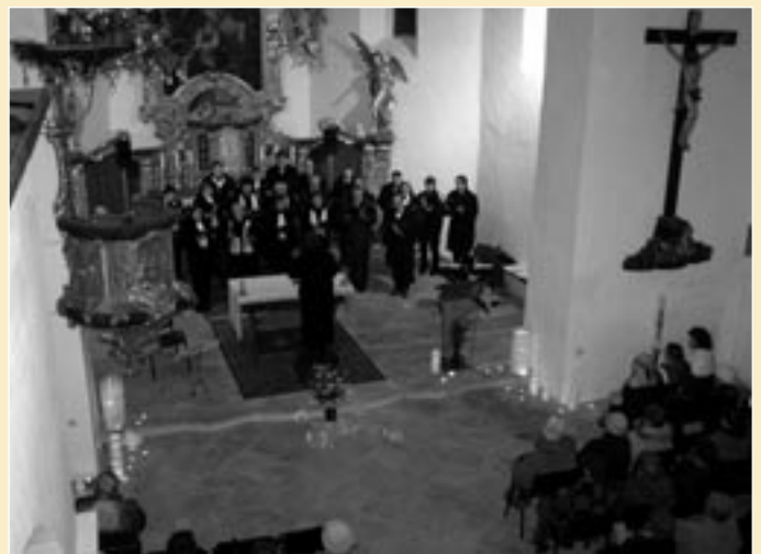
Benefiční koncert „Tichounce při svíčkách“