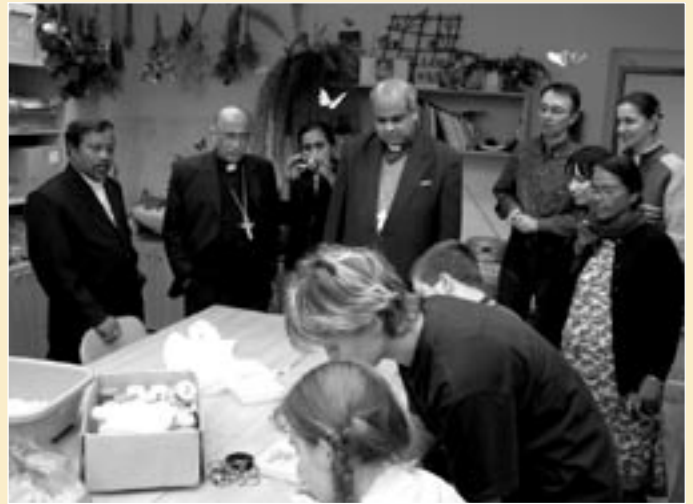
Návštěva tří indických biskupů z indického státu Severní Karnataka