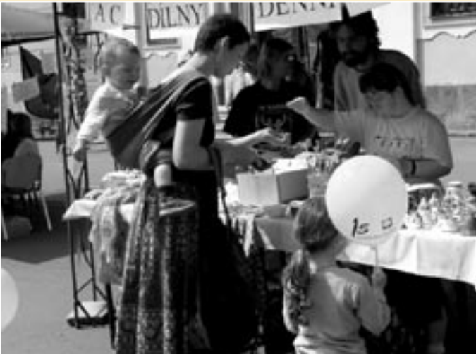
Prezentace středisek při 15. výročí založení Farní charity Polička