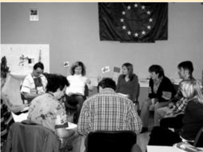
Psychoedukační kurz pro uživatele střediska „Otevřené dveře“