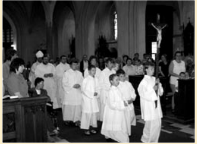
Děkovná mše svatá při 15. výročí založení Farní charity Polička