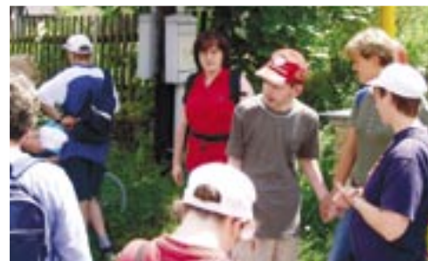
Rekondiční pobyt ve Světlé nad Sázavou