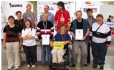
Veletrh „Rehab protex“ Brno

Denní stacionář úzce spolupracoval se zařízeními podobného typu: se „Svítáním“ v Pardubicích a se „Světlinkou“ ze Svitav, a dále s ústavy pro mentálně postižené ve Svitavách a v Bystřém.