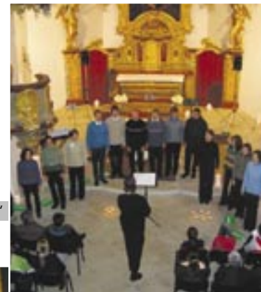
Benefiční koncert „Tichounce při svíčkách“